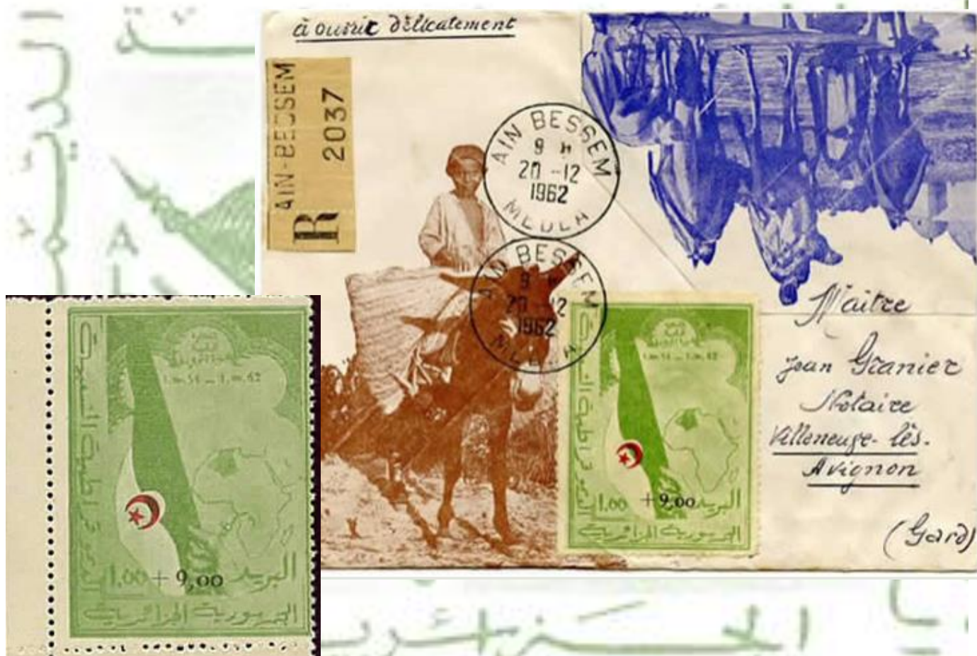
Le 1 er timbre algérien

Il sera retiré officiellement le 20 décembre 1962, mais il n'y en avait plus à la poste d'Alger depuis le 1er novembre au soir !